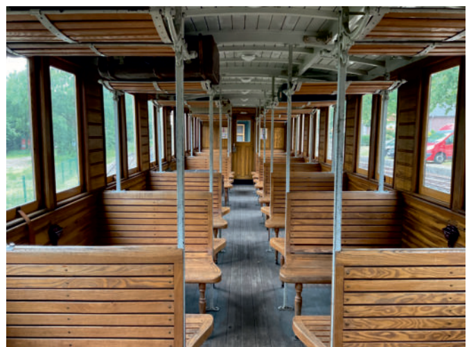
Innenaufnahme Wagen 122 am 1. Juli 2023