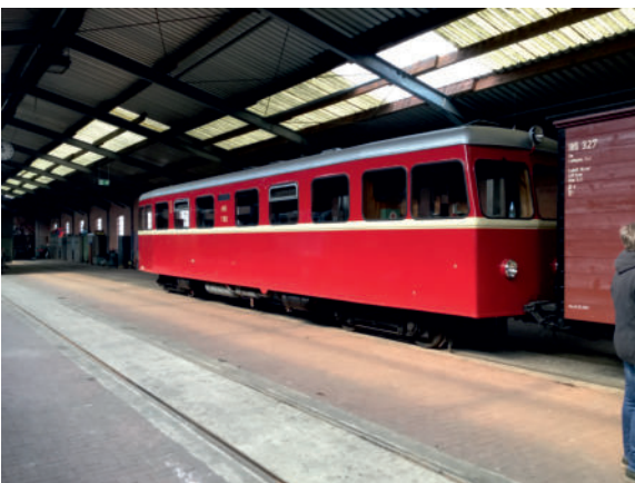
VT 102 bei den Harzer Schmalspurbahnen